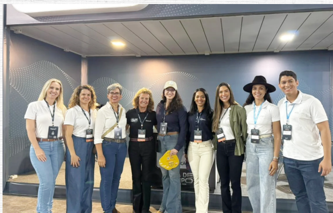
(Imprensa Aiba 9.2.2026)

Para apresentar as novidades em tecnologias para sementes voltadas às culturas de soja e de sorgo, foi realizado no sábado, 7 de fevereiro, o Dia de Campo da Oilema 2026. A Associação de Agricultores e Irrigantes da Bahia (Aiba), marcou presença no evento organizado pelo grupo Sementes Oilema, na Unidade de Beneficiamento de Sementes (UBS) da empresa, localizada em Placas, município de Barreiras. Em sua 27ª edição, o Dia de Campo Oilema se configura como um dos principais encontros técnicos do setor, e nasceu da demanda por sementes de alta qualidade, adaptadas às condições da região. Na oportunidade,